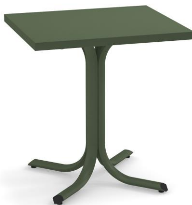
Table System ist die innovative Tischkollektion, entworfen im EMU Forschungs-zentrum, um den vielfältigen Ansprüchen des Objektgeschäfts gerecht zu werden; ein umfassendes Sortiment aus runden, quadratischen und rechteckigen Tischen mit festen und abnehmbaren Tischplatten. Diese Serie zeichnet sich durch die vielseitigen Einsatzmöglichkeiten aus, wobei die Tische sich ganz natürlich in jede Umgebung einfügen und sich mit allen Stühlen der EMU-Kollektionen kombinieren lassen.