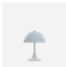
Panthella 250 Tischleuchte