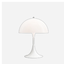
Panthella 400 Tischleuchte