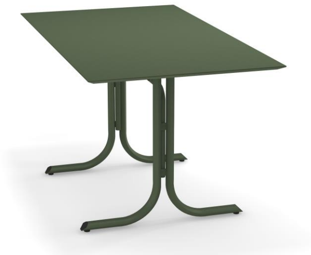
Table System ist die innovative Tischkollektion, entworfen im EMU Forschungs-zentrum, um den vielfältigen Ansprüchen des Objektgeschäfts gerecht zu werden; ein umfassendes Sortiment aus runden, quadratischen und rechteckigen Tischen mit festen und abnehmbaren Tischplatten. Diese Serie zeichnet sich durch die vielseitigen Einsatzmöglichkeiten aus, wobei die Tische sich ganz natürlich in jede Umgebung einfügen und sich mit allen Stühlen der EMU-Kollektionen kombinieren lassen.