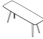
5102-A/-W B 278 T 87 H 107 Tisch