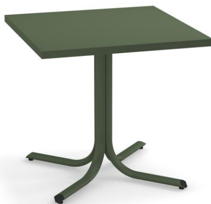
Table System ist die innovative Tischkollektion, entworfen im EMU Forschungs-zentrum, um den vielfältigen Ansprüchen des Objektgeschäfts gerecht zu werden; ein umfassendes Sortiment aus runden, quadratischen und rechteckigen Tischen mit festen und abnehmbaren Tischplatten. Diese Serie zeichnet sich durch die vielseitigen Einsatzmöglichkeiten aus, wobei die Tische sich ganz natürlich in jede Umgebung einfügen und sich mit allen Stühlen der EMU-Kollektionen kombinieren lassen.