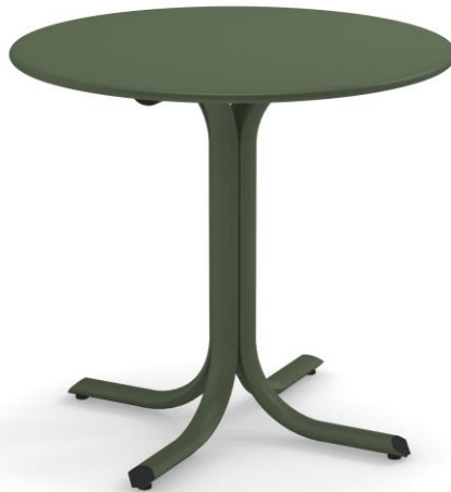
Table System ist die innovative Tischkollektion, entworfen im EMU Forschungs-zentrum, um den vielfältigen Ansprüchen des Objektgeschäfts gerecht zu werden; ein umfassendes Sortiment aus runden, quadratischen und rechteckigen Tischen mit festen und abnehmbaren Tischplatten. Diese Serie zeichnet sich durch die vielseitigen Einsatzmöglichkeiten aus, wobei die Tische sich ganz natürlich in jede Umgebung einfügen und sich mit allen Stühlen der EMU-Kollektionen kombinieren lassen.