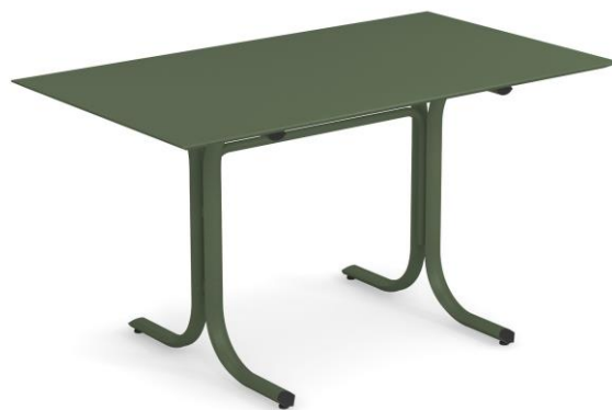
Table System ist die innovative Tischkollektion, entworfen im EMU Forschungs-zentrum, um den vielfältigen Ansprüchen des Objektgeschäfts gerecht zu werden; ein umfassendes Sortiment aus runden, quadratischen und rechteckigen Tischen mit festen und abnehmbaren Tischplatten. Diese Serie zeichnet sich durch die vielseitigen Einsatzmöglichkeiten aus, wobei die Tische sich ganz natürlich in jede Umgebung einfügen und sich mit allen Stühlen der EMU-Kollektionen kombinieren lassen.