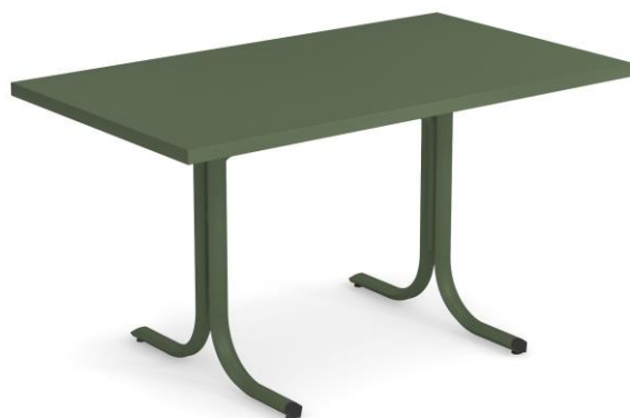
Table System ist die innovative Tischkollektion, entworfen im EMU Forschungs-zentrum, um den vielfältigen Ansprüchen des Objektgeschäfts gerecht zu werden; ein umfassendes Sortiment aus runden, quadratischen und rechteckigen Tischen mit festen und abnehmbaren Tischplatten. Diese Serie zeichnet sich durch die vielseitigen Einsatzmöglichkeiten aus, wobei die Tische sich ganz natürlich in jede Umgebung einfügen und sich mit allen Stühlen der EMU-Kollektionen kombinieren lassen.