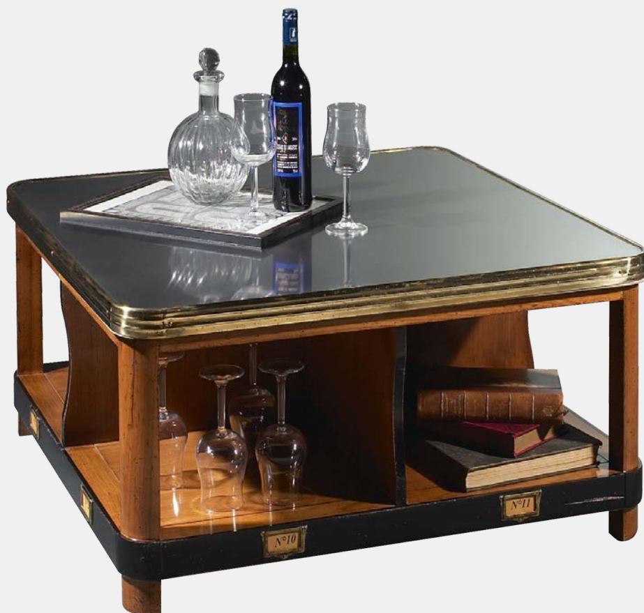
Table utilisée par le sommelier lors de la préparation des grands vins qui accompagneront harmonieusement quelques mets raffinés. Débouchage, vérification, décantage, avant un service au verre qui doit vous faire découvrir tous les mystères des vieux vins de garde.