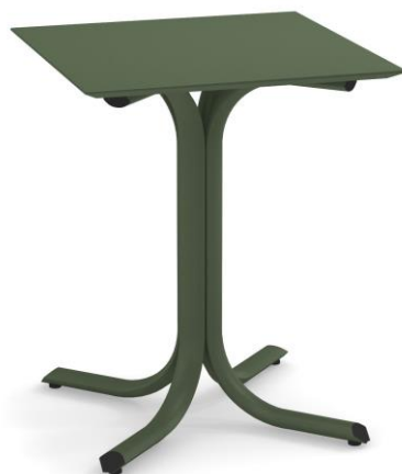
Table System ist die innovative Tischkollektion, entworfen im EMU Forschungs-zentrum, um den vielfältigen Ansprüchen des Objektgeschäfts gerecht zu werden; ein umfassendes Sortiment aus runden, quadratischen und rechteckigen Tischen mit festen und abnehmbaren Tischplatten. Diese Serie zeichnet sich durch die vielseitigen Einsatzmöglichkeiten aus, wobei die Tische sich ganz natürlich in jede Umgebung einfügen und sich mit allen Stühlen der EMU-Kollektionen kombinieren lassen.